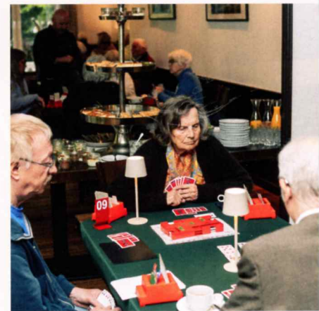
Ruhig und hochkonzentriert wird Turnierbridge an den Vierertischen gespielt.